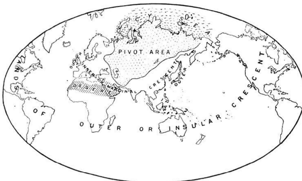
Figura 1 – Ilha-Mundo e Heartland (ou Pivot Area, Área Pivô) segundo Mackinder